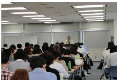
※過去の講義風景です