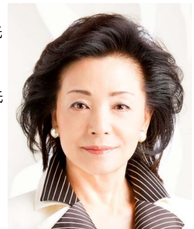
櫻井 よしこ 氏 ジャーナリスト

クリスチャンサイエンスモニター紙 東京支局の助手としてジャーナリズムの仕事を始め、アジア新聞財団 DEPTH NEWS 記者、東京支局長、NTVニュースキャスターを経て、現在に至る。2007年にシンクタンク、国家基本問題研究所を設立し、国防、外交、憲法、教育、経済など幅広いテーマに関して日本の長期戦略の構築に挑んでいる。