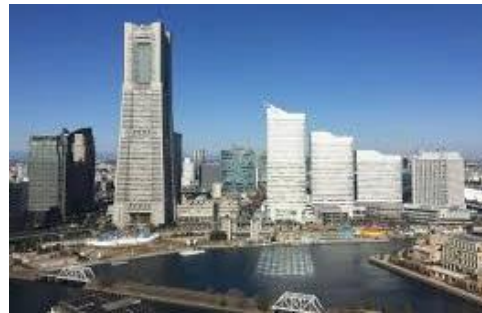
Minato Mirai 21 District (Kanagawa – Urban new town on reclaimed land)