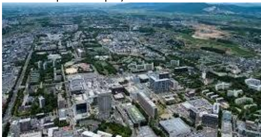
Tsukuba Science City (Ibaraki – The sole city for research and education in Japan)