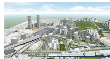
Bang Sue District (Thailand, Bangkok – Development of large-scale master plan at former factory site)