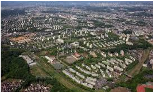
Tama New Town District (Tokyo - The largest scale of new town development in Japan)

As a group company of UR, UR Linkage is a company that supports comprehensive development of communities and housings for large-scale urban development projects in Japan, through a broad scope of services ranging from project planning/concept planning stage, actual planning/design stage, quantity survey/construction/supervision stage, and to sales/management stage. While at the same time, by cooperating with Japanese government agencies, UR Linkage has long been providing operation management of working groups of "Japanese Conference for Overseas Development of Eco-Cities (J-CODE)", in which we provide support in developing and promoting projects and conducting studies to promote Japanese companies to expand their business to emerging countries such as ASEAN regions. Following are some example of our domestic and international projects.