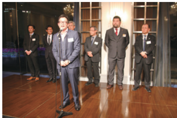
▲新入会員の自己紹介