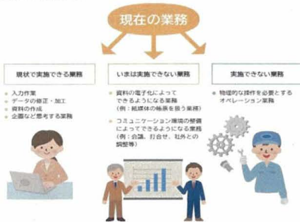
図表 Ⅱ-4-1 対象業務の整理